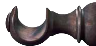
Kannake 12 cm