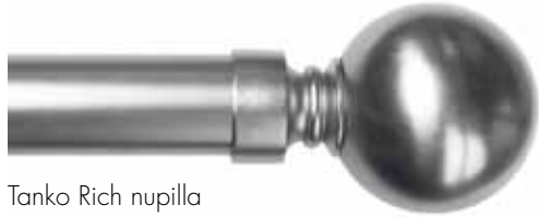
Tanko Rich nupilla