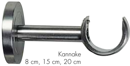
Kannake 8 cm, 15 cm, 20 cm