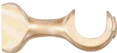
Kannake 12 cm, 18 cm