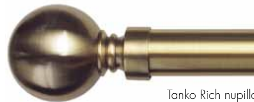
Tanko Rich nupilla