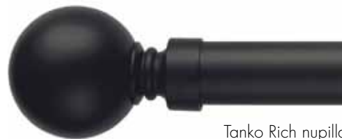
Tanko Rich nupilla