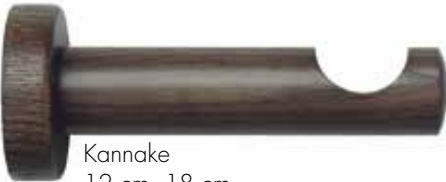
Kannake 12 cm, 18 cm