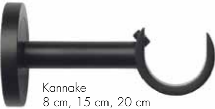
Kannake 8 cm, 15 cm, 20 cm