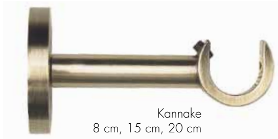
Kannake 8 cm, 15 cm, 20 cm