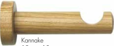
Kannake 12 cm, 18 cm