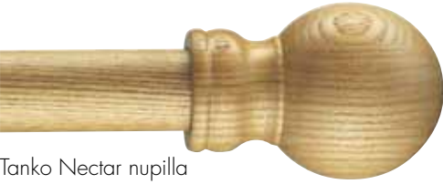
Tanko Nectar nupilla