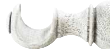
Kannake 12 cm