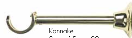
Kannake 8 cm, 15 cm, 20 cm