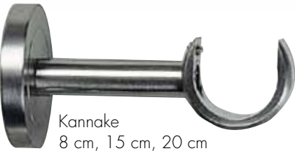
Kannake 8 cm, 15 cm, 20 cm