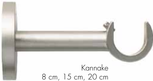
Kannake 8 cm, 15 cm, 20 cm