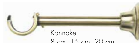
Kannake 8 cm, 15 cm, 20 cm