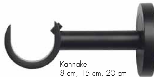
Kannake 8 cm, 15 cm, 20 cm